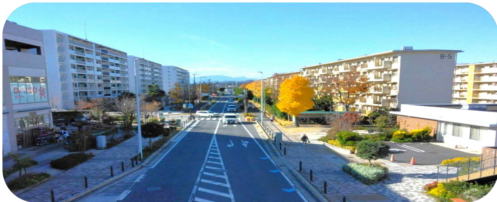
鉄砲道を挟んで南側は4, 5街区・右側は旧街区