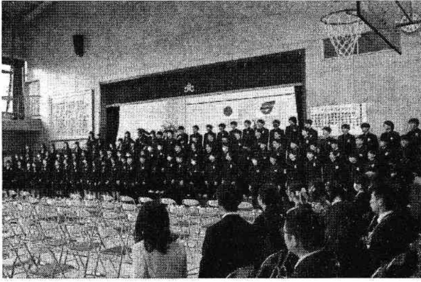
(卒業証書授与式—卒業生合唱)