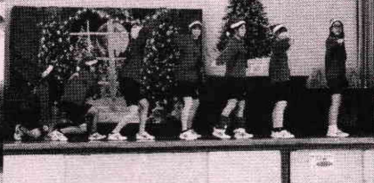
▲ 中学生有志によるダンス