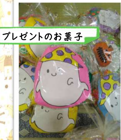
プレゼントのお菓子