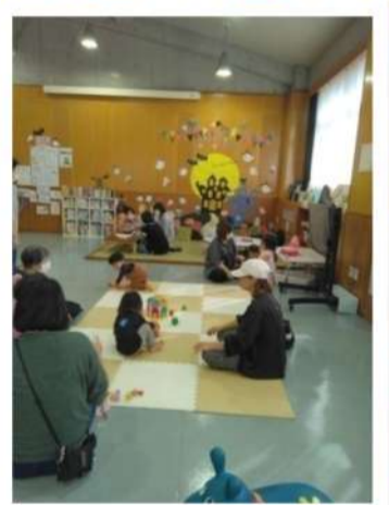
ハロウィーンの飾りつけ