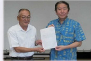
市長へ要望書手渡し

行政出席者：10名(市長、副市長、担当部課長等) 市議会議員：4名 湘南地区出席者：30名(湘南地区まちぢから協議会運営委員及び地域住民)