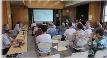
総勢44名による意見交換会

内容は、3部構成で、第一部では「道の駅開発事業について」行政より報告がなされました。その後、質疑応答を行ないました。続いて、第二部では、防災取り組み点検として「～河川氾濫や内水氾濫対策について～」の要望を行い、その後、質疑応答を行いました。最後に、第三部では、自治会長を務める委員からの地域の課題を説明し、要望書として市長へ手渡し、別途、書面にて回答をもらう事としました。