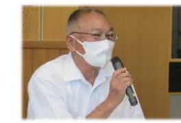
提案する高山会長