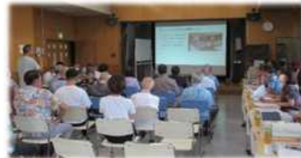
質問する地域住民