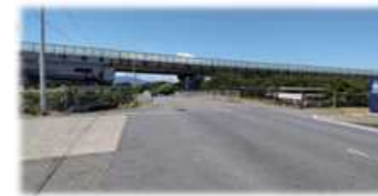
両側の歩道幅が狭い