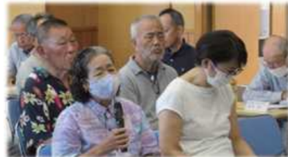
質問する地域住民