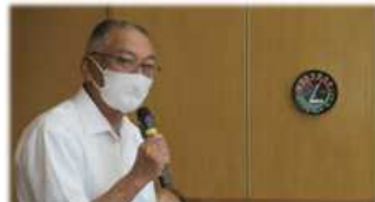
提案する高山会長

線状降水帯発生による河川氾濫や、雨水・下水排水処理能力が、現気象状況に十分な性能であるかを検証し、他地区で生じている様な災害へのリスクを公開していただき、ポンプ場の処理能力対策が必要な場合は、性能向上対策をお願いしました。