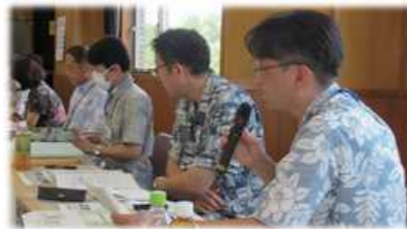
質問に対する行政からの回答