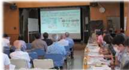
道の駅開発事業について説明

本件に関し、道の駅整備推進担当課より開発事業について説明が行われ、その後、質疑応答を行いました。