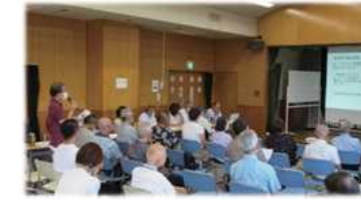
提案する甲賀自治会長 (ベルパーク湘南茅ヶ崎自治会)

新湘南バイパス下、側道に接したベルパークE館エントランスに道路からの雨水流れ込みが発生しています。側溝の排水能力改善をお願いします。