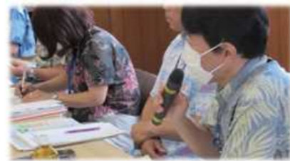
質問に対する行政からの回答