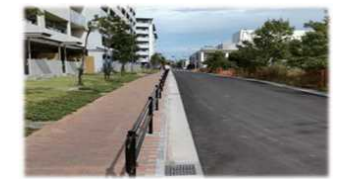
しろやま公園に新設された道路

上記、5件(しろやま公園横の道路整備除く)の提案要望に関しては、別途行政より回答書をお願い展開します。