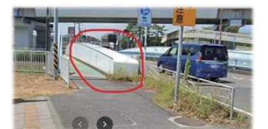
欄干は背が高く、左折する際見通しが悪い