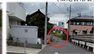
南に進むと道路幅が狭くなっている