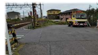
松尾踏切、車両停滞が起こる