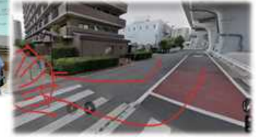
道路から雨水が流れ込む方向