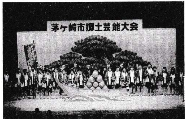
茅ヶ崎市郷土芸能大会