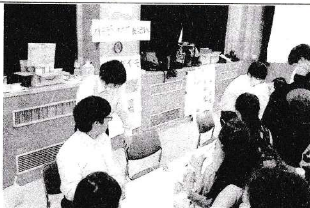
(湘南地区コミセンまつり—科学部)

では、皆さん良き年末年始をお過ごしください。そして、1月9日に全員が元気に登校してください。ここまで、皆さんの優しさ、本当にありがとうございました。