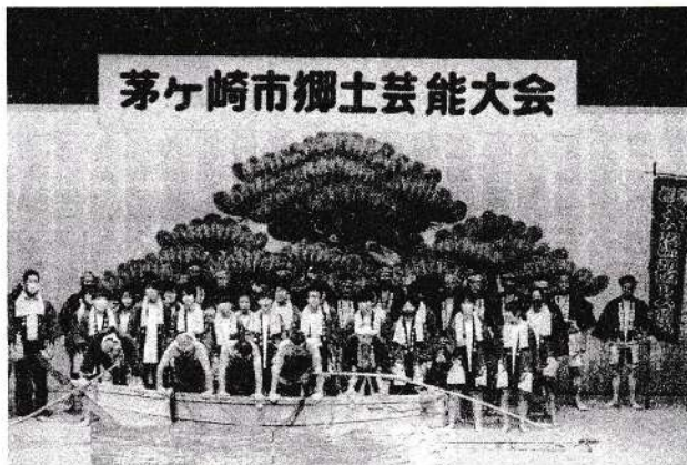
茅ヶ崎市郷土芸能大会

中島中学校の学校目標に「郷土愛」があります。このような機会が再開でき、多くの生徒が参加してくれたことが本当に嬉しかったです。参加した生徒の皆さん、ご苦労様でした。