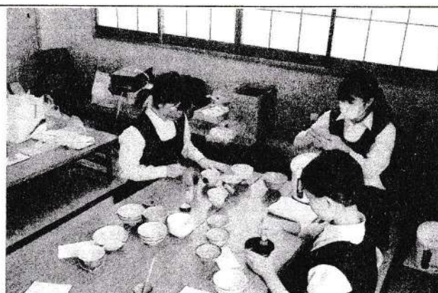
(湘南地区コミセンまつり—調理手芸部)