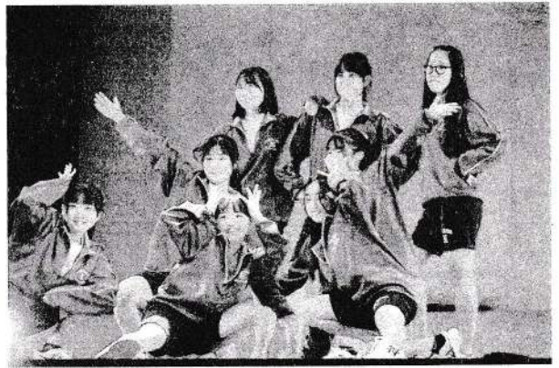
※生徒・保護者から掲載の許諾はいただいています。

11月11日、寒川町民センターにおいて茅ヶ崎地区中学校ダンス発表会が行われました。茅ヶ崎地区内中学校16校各校からの代表作品が同ステージで披露されました。本校からは3年生の