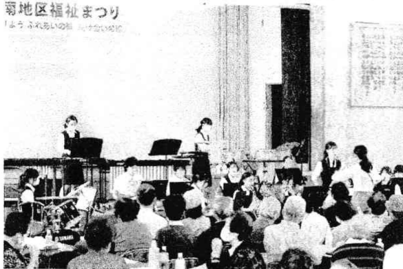
（吹奏楽部－湘南地区福祉まつりにて）