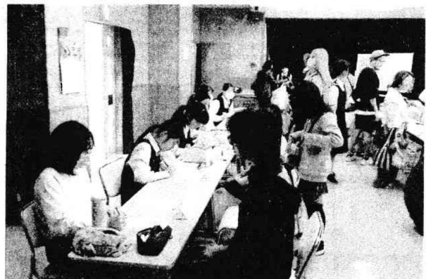
（美術部－湘南地区コミセンまつり）