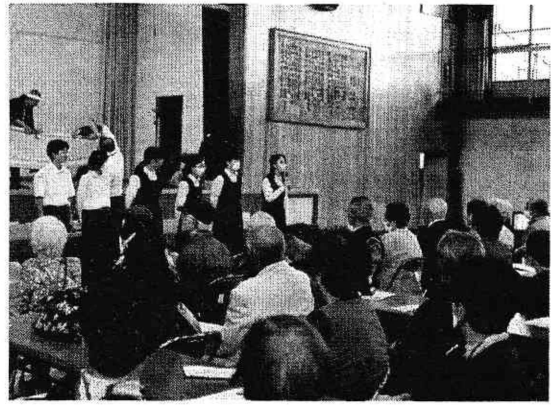
(生徒会役員ー湘南地区福祉まつりにて)