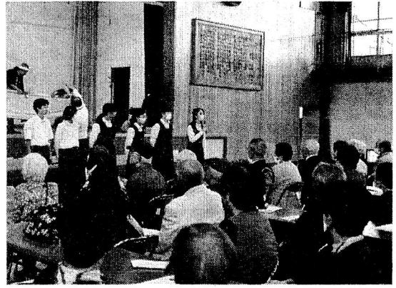
(生徒会役員ー湘南地区福祉まつりにて)