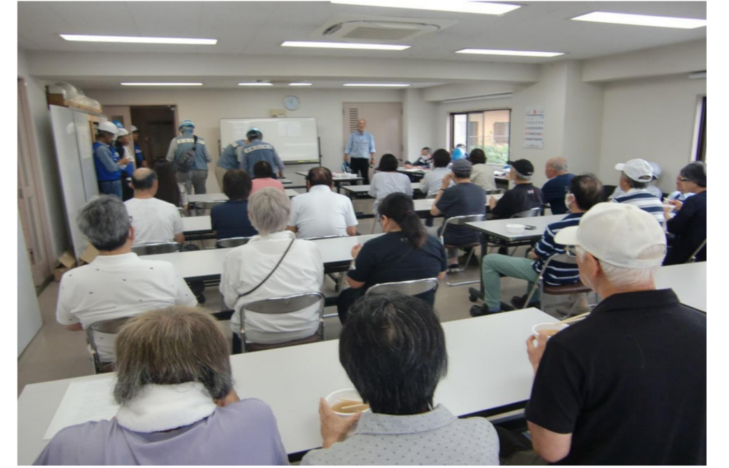
終了後、2階洋室にて訓練総評実施