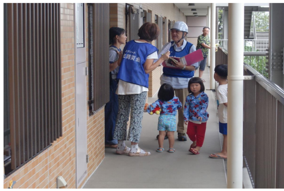
1階～4階住民への巡回避難告知