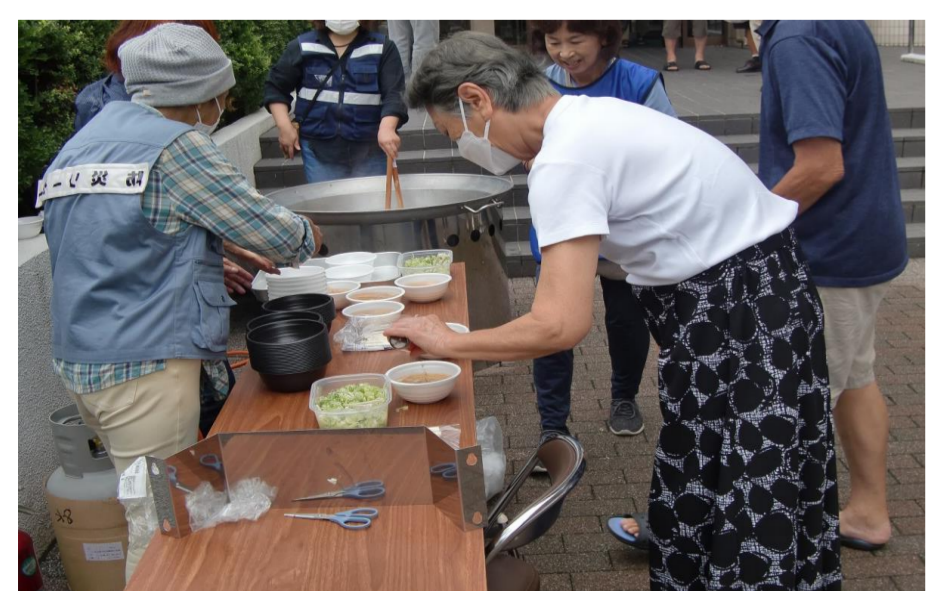
約80食分のとん汁を作り参加者へ配布