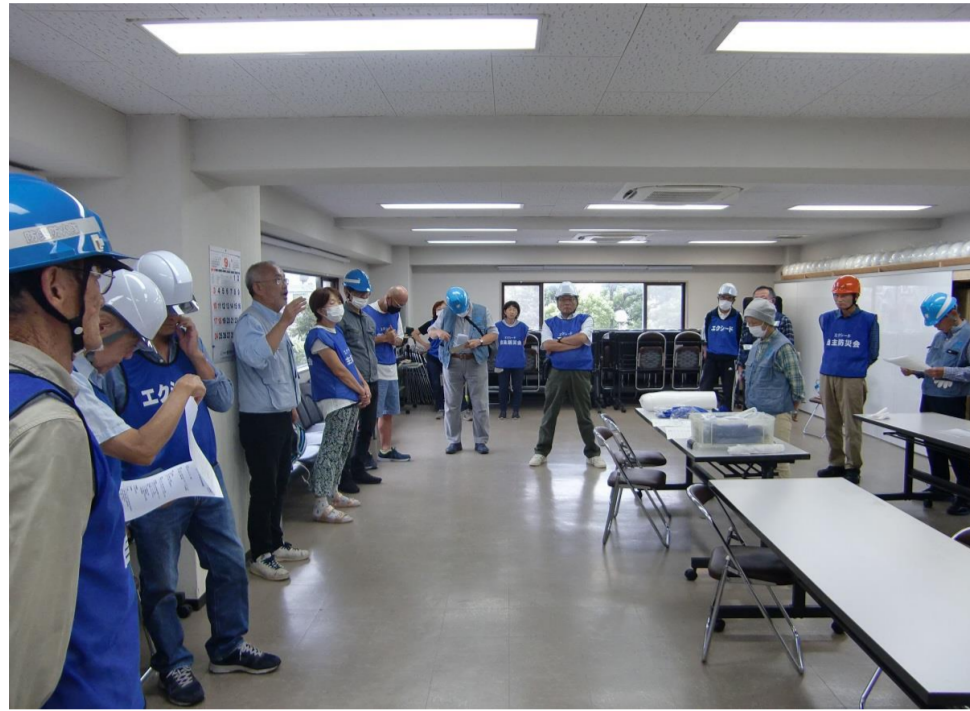
訓練前の事前説明