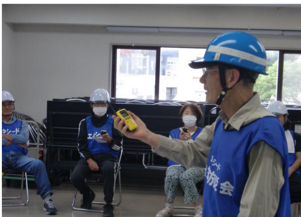
訓練前にトランシーバー操作説明