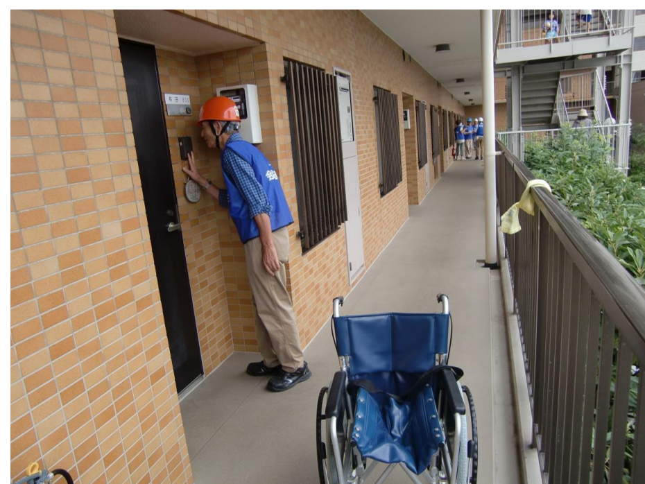
車椅子と共に要支援者へ避難告知