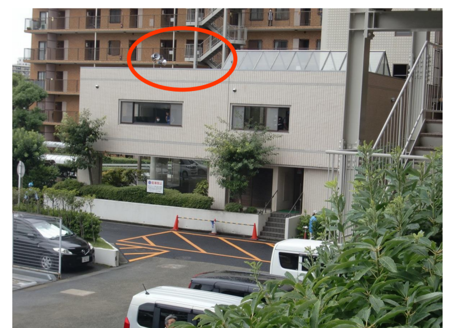
2階洋室屋上に拡声器を設置