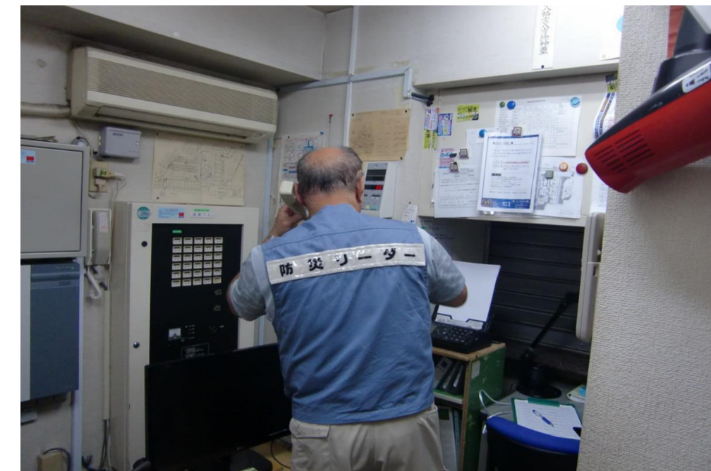
管理人室から全戸一斉インターホン

2023年度防災活動計画に基づき、防災訓練「秋」を9月9日(土)10時から当マンション全戸対象に実施しました。