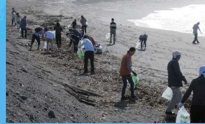
多くのゴミを回収