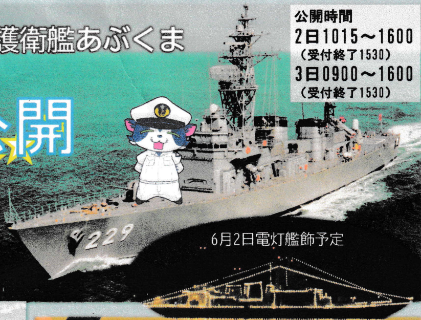
6月2日電灯艦飾予定

公開時間 2日1015~1600 (受付終了1530) 3日0900~1300 (受付終了1230)