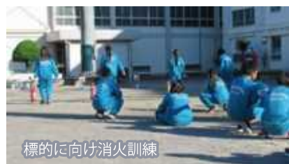
標的に向け消火訓練