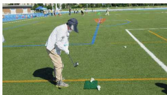
ターゲットバードゴルフ