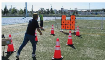
ストラックアウト