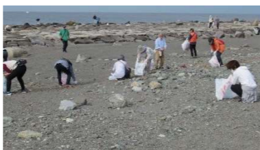
多くのゴミを回収