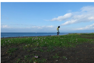
国道134線柳島海岸交差点歩道橋を渡り海岸へ、サイクリングロードを東へ、海側に在ります。