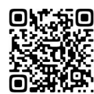
タウンニュース茅ヶ崎版 2021年5月21日号

今回の取り組みを(株)タウンニュース社湘南版に掲載していただき、湘南地区外の住民からも協力依頼等があり、準備したプランター全て、1週間足らずでなくなりました。