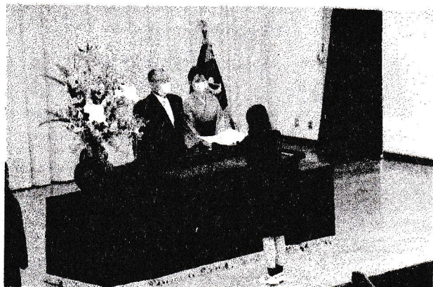
(第45回卒業証書授与式)