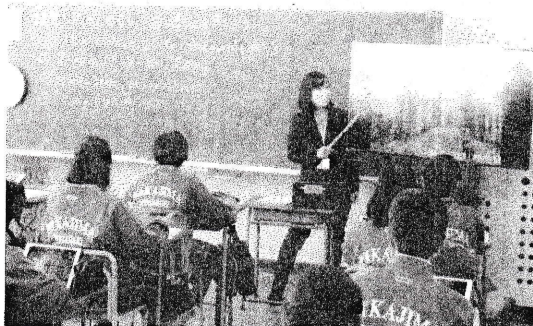
(学習指導講座－1年2組授業風景)

最後に、今年も校内・校外での生活で、新型コロナウイルス感染症予防対策を全員で意識し、今を大切に、頑張っていきましょう。～