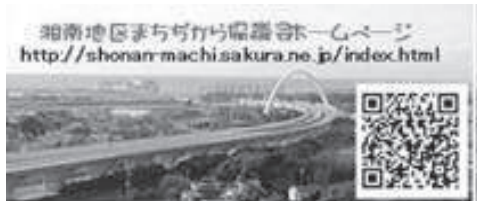
ホームページのアドレスです