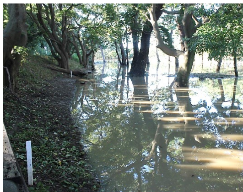
10月13日朝、旧堤防からゴルフ場を写す。 安心して夏の台風シーズンを迎えるためにも各家庭は備えをしっかりとる、行政には早期の堤防完成を望む。

神川橋では10月13日午前0時30分に最高水位に達した(氾濫危険水位まで46cmだった)