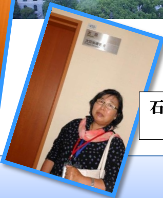
石井国土交通大臣 執務室前で