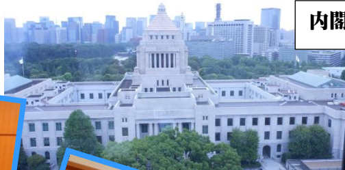
内閣官房水循環政策本部