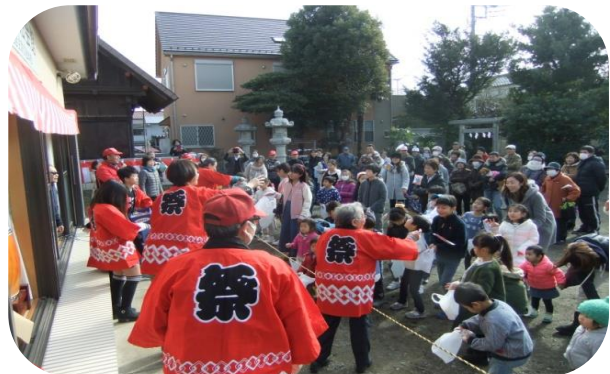
ちびっこ向け、お菓子やあめいっぱいとれたかな？