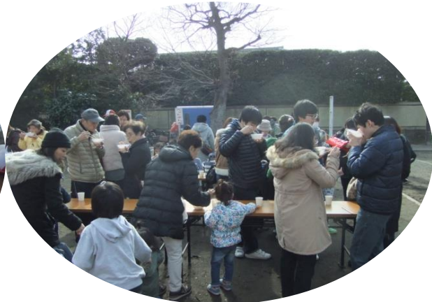
寒い時期は、やっぱり暖かい、いも煮に限るね。 今日は3杯はいけるかな！