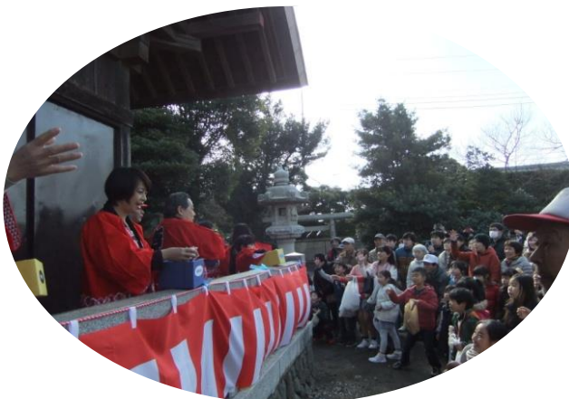
当たりのシールついてたかな？