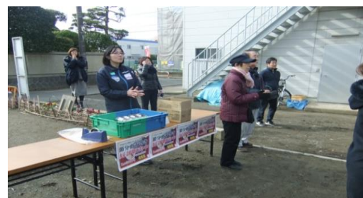
ファミリーマートさんが恵方巻きの販売