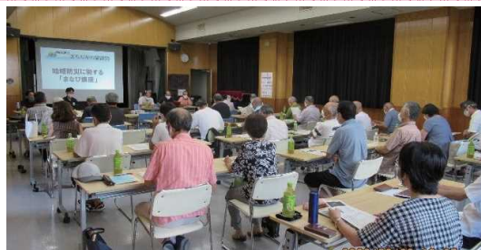
各自治会、各種団体と防災対策課との情報交換会

湘南地区でも豪雨による相模川の氾濫危機となり、避難所、避難のタイミング等、混乱する事態になりました。このことから、湘南地区まちぢから協議会として、防災に関する啓発のため、令和2年9月6日に、各自治会(各自主防災会)、各種団体の代表者と市防災対策課との地域防災に関する情報交換会を開催しました。その中での課題として、地域住民の防災意識の重要性が不可欠であり、住民一人一人が自発的に状況を予想し、より安全な避難行動をとるためには、対象とする地域の特徴及び茅ヶ崎市が出す警戒レベルに合わせて行動する必要があり、湘南地区独自の「洪水対策マニュアル」冊子を発行し、全戸配布することとしました。