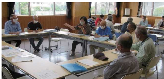
戸建て・集合住宅の2班に分けて冊子検討