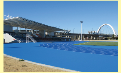
▲ 南側から見た陸上競技場

3月25日(日)に開園の際には、オープニングセレモニーが行われます。湘南地区からは、柳島神輿会、中島中学校の吹奏楽部が参加し、セレモニーを盛り上げる事が企画されています。