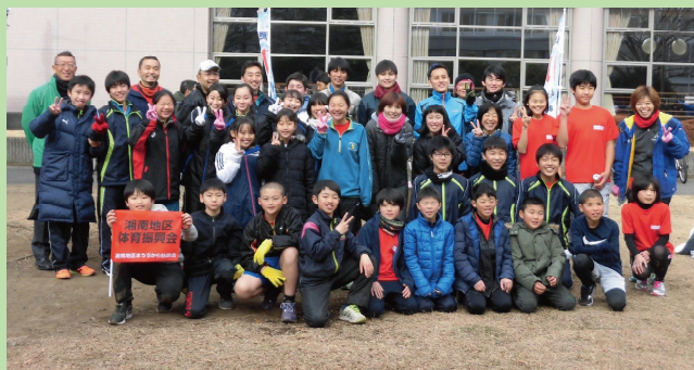
▲ 参加した湘南地区8チームのみなさん

コースは 男子1・2部 1区から5区 総距離 28,600m 女子1・2部 小学生の部 1区から5区 総距離 13,600m