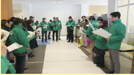
▲ 行政より概要説明を受ける様子

1月27日(土)に地域及び学校関係者約40名で「柳島スポーツ公園」の現地視察を実施しました。