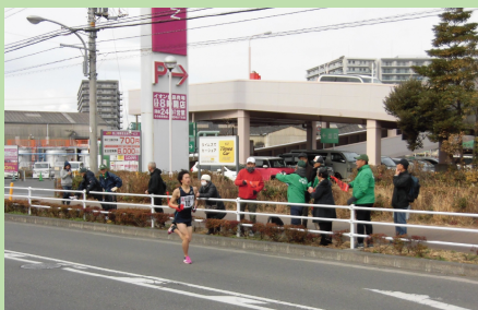
▲ 沿道で応援の様子

1月8日(月・祝)成人の日に、茅ヶ崎市スポーツの一大イベントの高南一周駅伝大会が開催されました。今年は第80回を迎える記念大会ということもあり、湘南地区から8チーム(柳島小学生3チーム17名、一般男女チーム5チーム25名)総勢42名の選手が参加しました。当日は寒い中、コース沿道にて当地区の方々から沢山の応援を頂き、誠にありがとうございました。