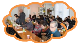
足柄地区社協の皆さん

☆11月29日(火)、シルバー人材センター・セカンドライフコンシェルジュさんが来られました。今後ボランティアを希望される方を活動に繋げるようにご協力をお願いしました。